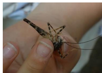
マダラカマドウマ