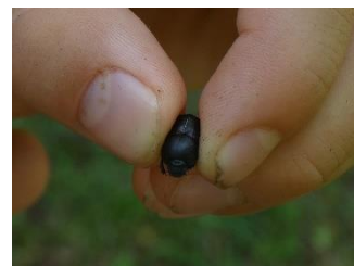
クロマルエンマコガネ