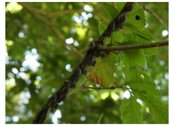
アカホシテントウ (サナギ)