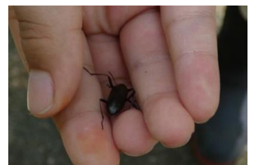
ホソキマワリの一種