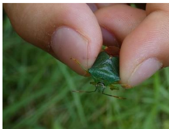
アオカメムシの一種