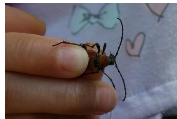
アカハナカミキリ