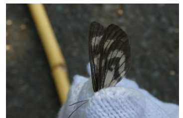
トンボエダシャク