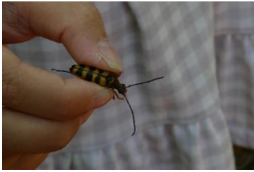
ヨツスジハナカミキリ