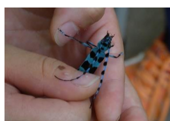
ルリボシカミキリ