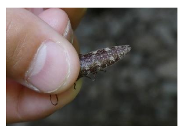
ヒメシモフリコメツキ