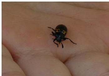
ヒメオビオオキノコムシ