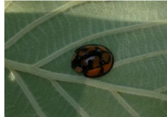
カメノコテントウ