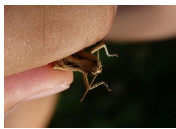
ヒロバネヒナバッタ