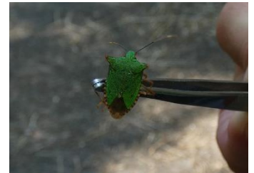
ツノアオカメムシ