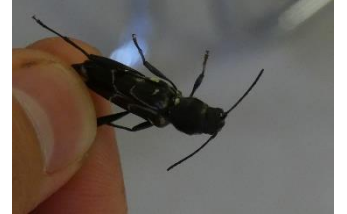
ウスイロトラカミキリ