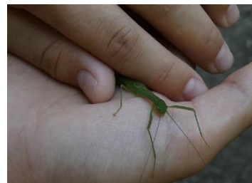
ヤスマットピナナフシ