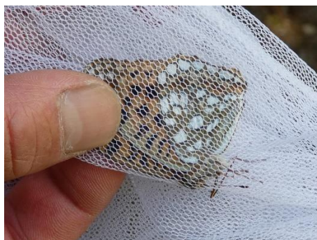
ウラギンヒョウモン