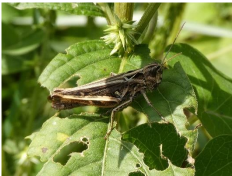
ヒロバネヒナバッタ