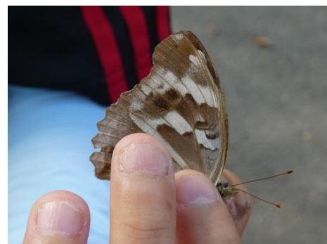
メスグロヒョウモン