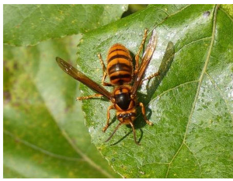
キイロスズメバチ