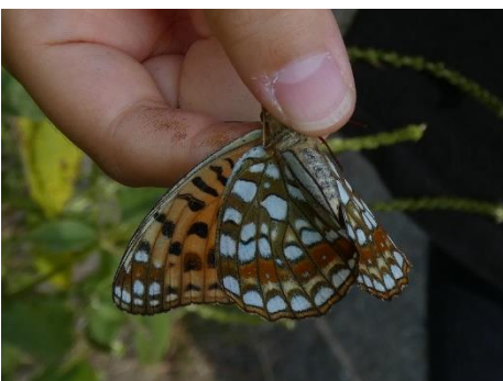
ウラギンヒョウモン