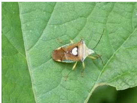
エサキモンキツノカメムシ