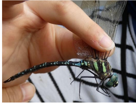
オオルリボシヤンマ