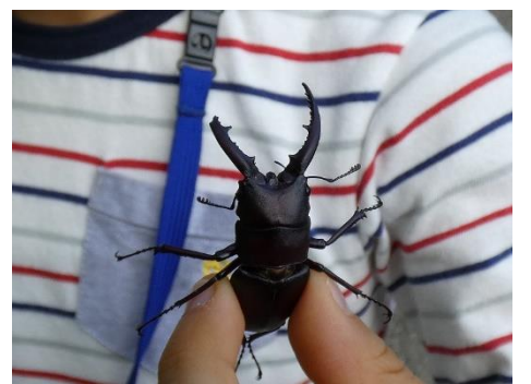
ノコギリクワガタ