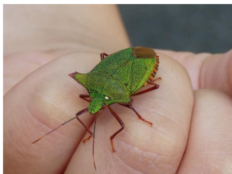
ツノアオカメムシ