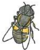
アブ・ハエの仲間