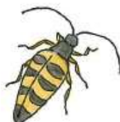
カミキリムシの仲間