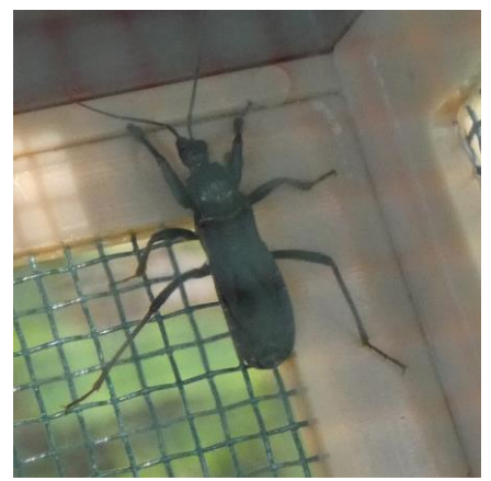
クロモンサシガメ