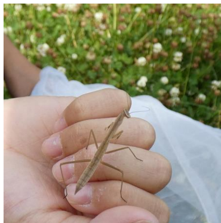
オオカマキリ（幼虫）