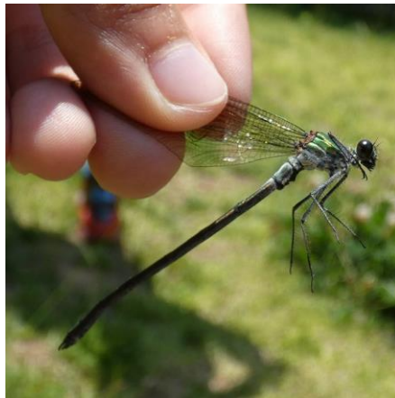
ニホンカワトンボ