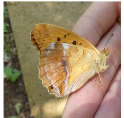
メスグロヒョウモン