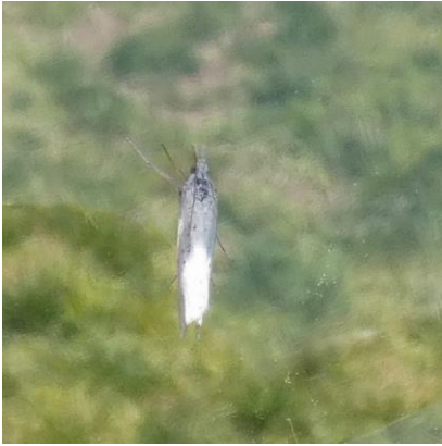
ウリハムシモドキ