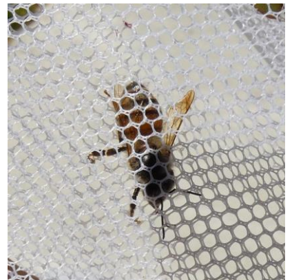
セイヨウミツバチ