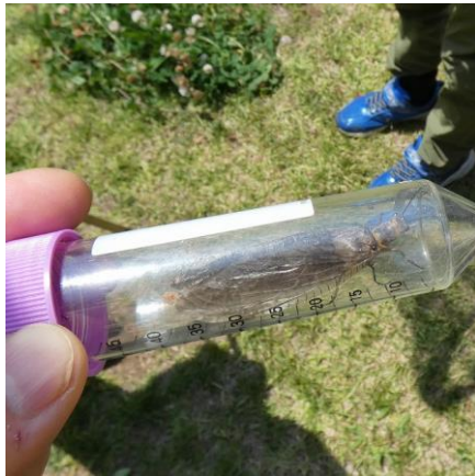
ヤマトスジグロヘビトンボ