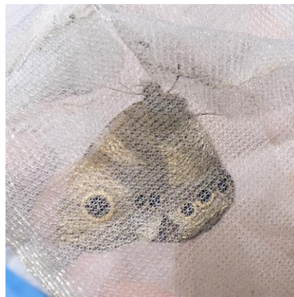
ヒメウラナミジャノメ