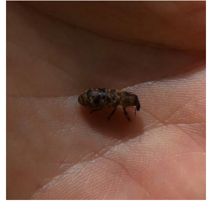
ヒメリンゴカミキリ