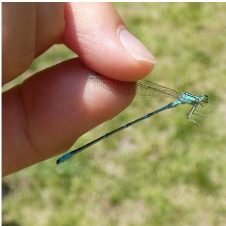
ホソミオツネントンボ

PICNIC FIELD ピクニック フィールド とトンボ池では、草地や池に生息している昆虫が多くみられ、トンボ池周辺では数種類のトンボが捕れていました。PICNIC FIELD ピクニック フィールド の奥の方にあるカリンの木では実に集まるモモチョッキリを捕まえた方もいました。