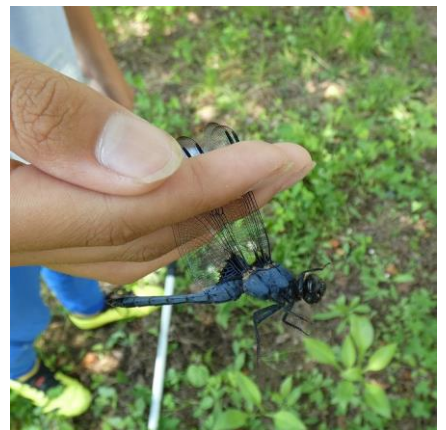
オオシオカラトンボ