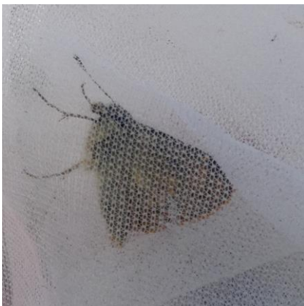
セセリチョウの仲間