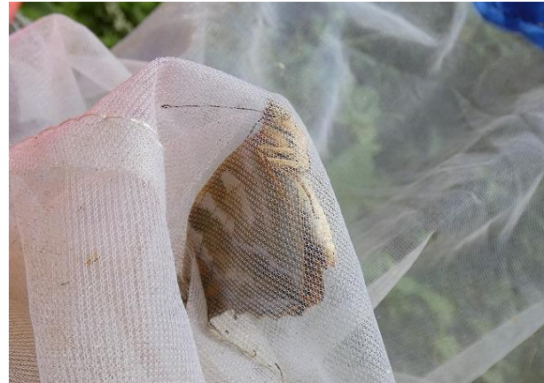
ミドリヒョウモン

わんぱくフィールド WANPAKU FIELDから麒麟下 む へ向かう道では、アジサイの花弁によくいるヨツスジハナカミキリもつけることができました。アジサイは咲いてる時期に限られるため、次回の例会でも是非探してみてください。前回の例会で多く見られたウスバシロチョウは今回の例会で余り見かけることはありませんでした。季節によって捕れる昆虫が変わってきますので、どの時期にどんな昆虫を見かけたか覚えておくと、来年の昆虫採集のヒントになりますよ。