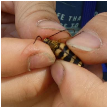
ヨツスジハナカミキリ