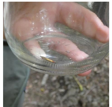
クロマイコモドキ