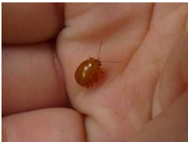
オオキイロマルミノハムシ