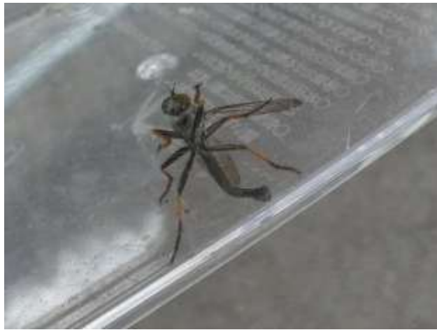
ムシヒキアブの一種