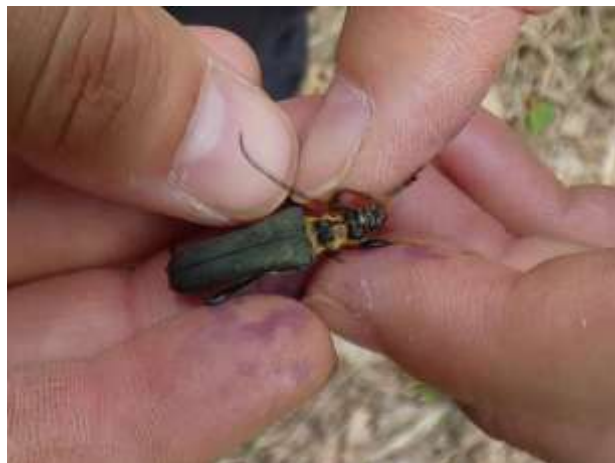
フタコブルルハナカミキリ