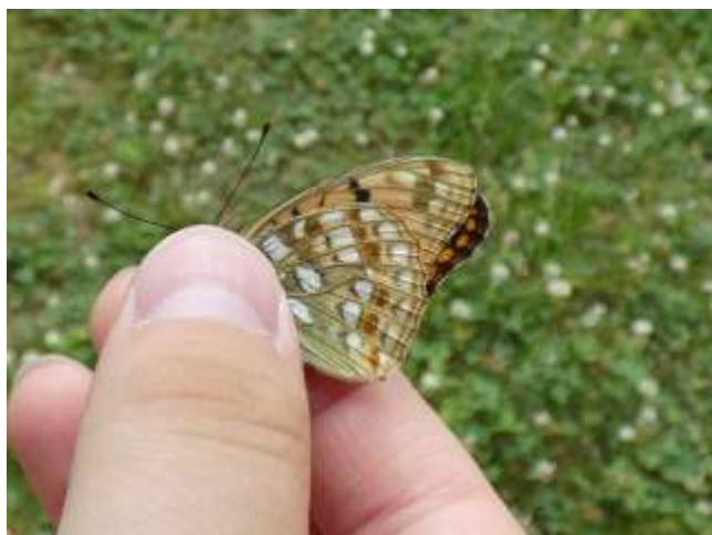
ウラギンヒョウモン