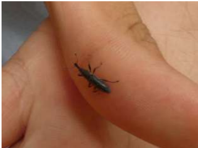
ナガカツオゾウムシ