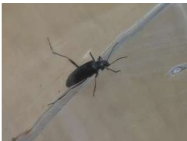
クロナガキマワリ