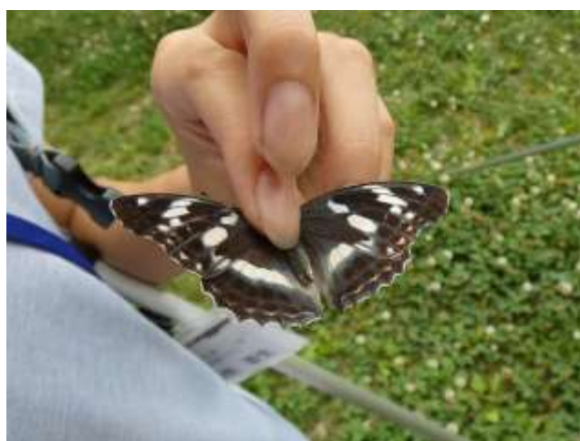
メスグロヒョウモン