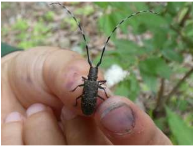
ヒメヒゲナガカミキリ