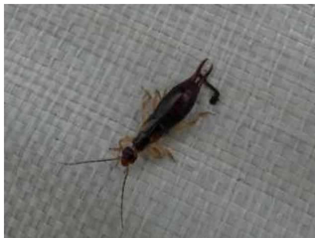
クヌギハサミムシ