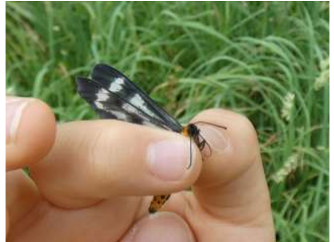
トンボエダシャク