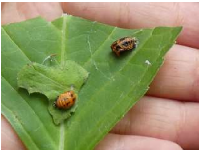
ナミテントウ（サナギ）