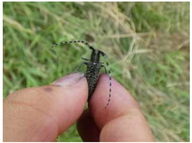
ミチノクケマダラカミキリ