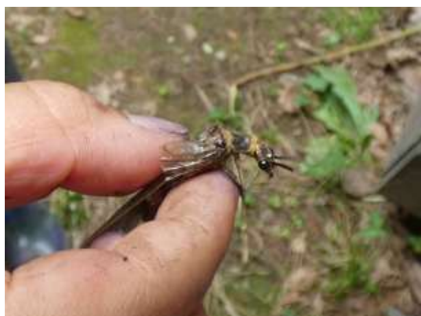
ヤマトスジグロヘビトンボ