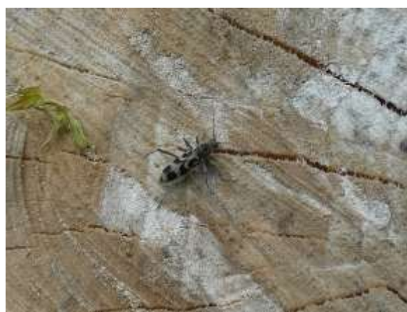
クロトラカミキリ