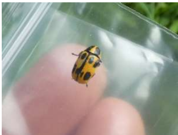
ヤツボツツハムシ