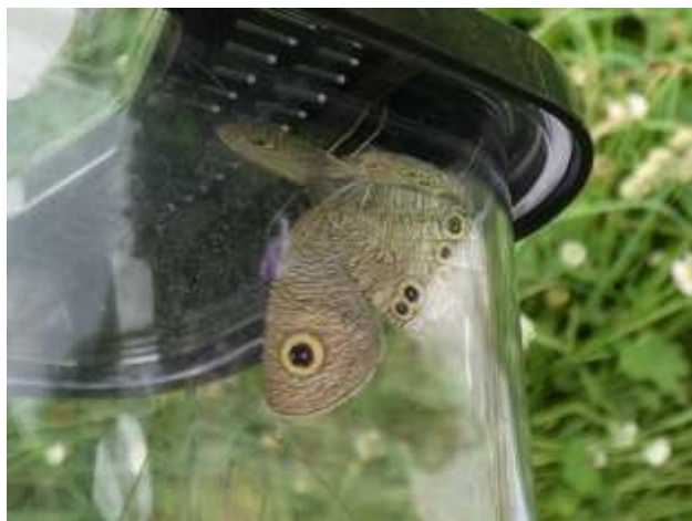
ヒメウラナミジャノメ