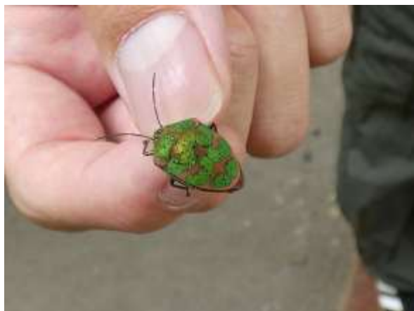
アカスジキンカメムシ