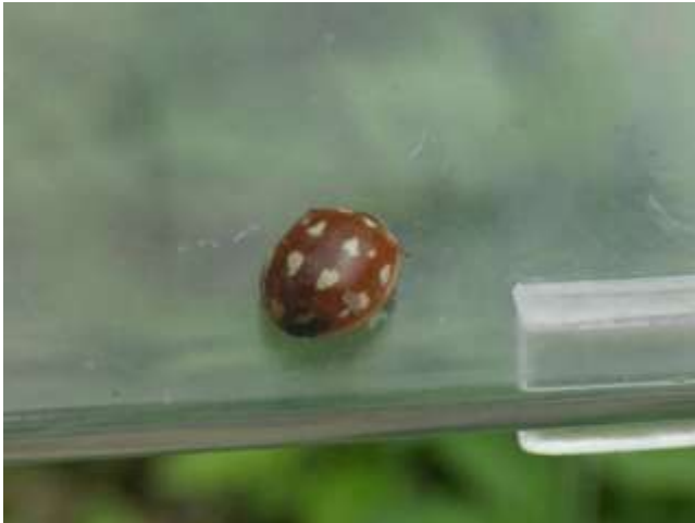
シロホシテントウ？