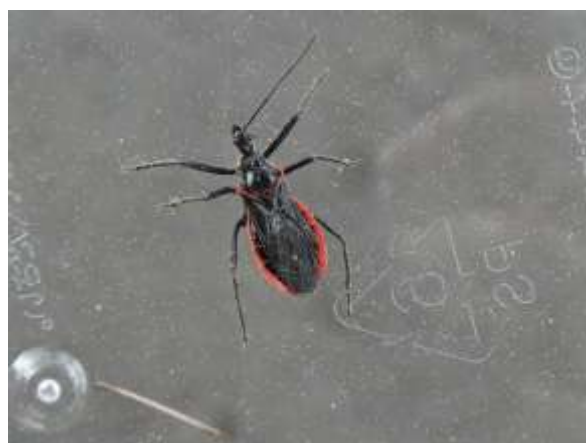
アカヘリサシガメ